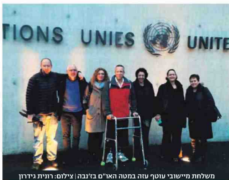
משלחת מיישבי עוטף עזה במטה האו"ם ב'נבחה'